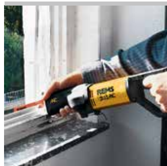
Produit allemand de qualité