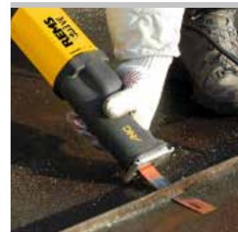
Tested by electrosuisse >>>